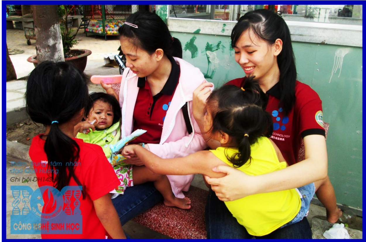
Các bạn sinh viên chơi với các bé tại Trung tâm

Tại đây, các bạn dùng quà chuẩn bị sẵn phát tặng cho các bé, mỗi bé đều có một phần quà riêng của mình. Sự hồn nhiên của các bé và quan trọng hơn là sự thiếu thốn tình cảm của chúng làm cả đoàn chúng tôi càng thấy chuyển đi của mình càng ý nghĩa hơn. Bọn trẻ hòa vào chúng tôi cùng chơi đùa, cùng ăn bánh, cùng chia sẻ.