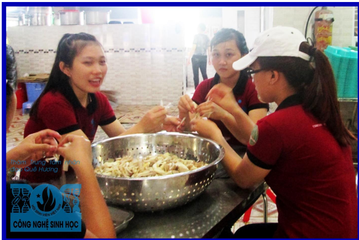
Các bạn sinh viên hỗ trợ làm bữa trưa cho các bé

Chuyến đi góp phần gắn kết các thành viên của lớp DH14SHA lại gần với nhau và giúp các bạn hòa nhập vào cộng đồng và đem tình yêu thương xuất phát từ chính trái tim đến với các bé có hoàn cảnh đặc biệt khó khăn. Hi vọng sẽ có nhiều hoạt động ý nghĩa hơn nữa dành cho các bạn hội viên, sinh viên của Chi hội đến với cộng đồng, xã hội.